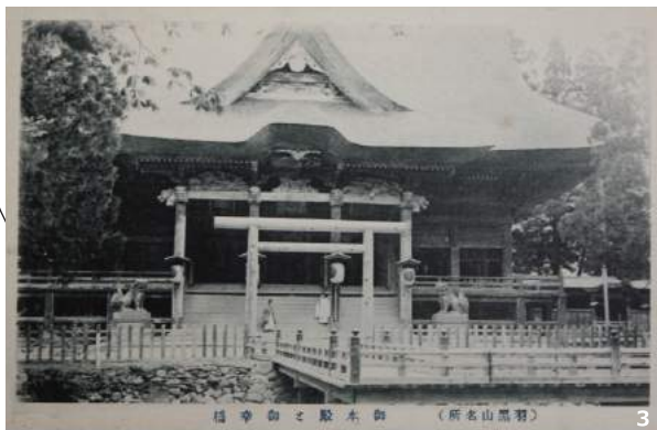
橋守御と殿本御 (所名山黒羽) 3