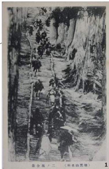
景全図ノ二 (所名山黒羽) 1