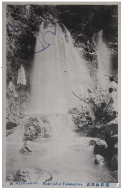
Water-fall of Tudenoyama. 湯殿山殿瀧 7