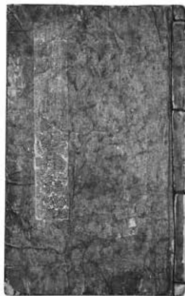
1 - 23 羽州最上 白岩目安